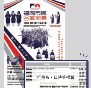
▲過去のリーフレット