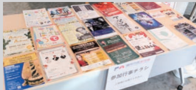
後援名義の個別申請は不要です (※1)