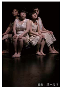
KIKIKIKIKI 07年「踊りに行くぜ!! vol.8」福岡公演より

【主催】コデックス、(財)福岡市文化芸術振興財団、福岡市 「踊りに行くぜ!!」全体企画: NPO法人 Japan Contemporary Dance Network (JCDN)