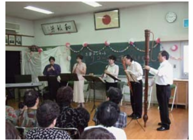
和自公民館での様子

「芸術交流宅配便」に関するお問い合わせ 活動支援係 担当：矢住・植田 Tel:092-263-6266 Fax:092-263-6259 E-mail:npo-a@ffac.or.jp