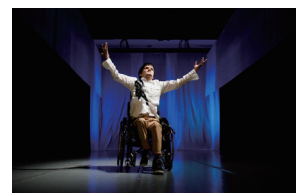
過去公演の様子（平成 26 年度）