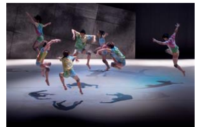
「モナカ」(初演: KAAT 神奈川芸術劇場 2015年)

【お問合せ】 (公財)福岡市文化芸術振興財団 舞台芸術振興課(宮崎) TEL: 092-263-6266 FAX: 092-263-6259