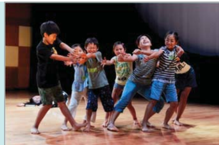
昨年の様子